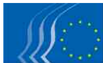
Comitetul Economic și Social European http://eesc.europa.eu