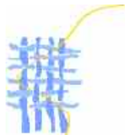
Ombudsmanul European http://www.ombudsman.europa.eu