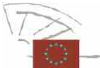
Parlamentul European http://www.europarl.europa.eu/