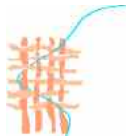
Ombudsmanul European http://www.ombudsman.europa.eu