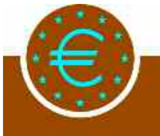
Banca Centrală Europeană http://www.ecb.eu